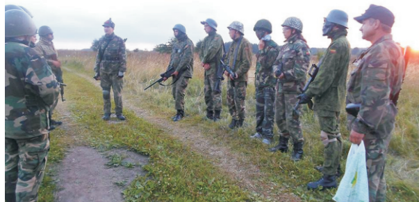
Instruktažas prieš žaidimą su pirmojo pasaulinio karo tematika